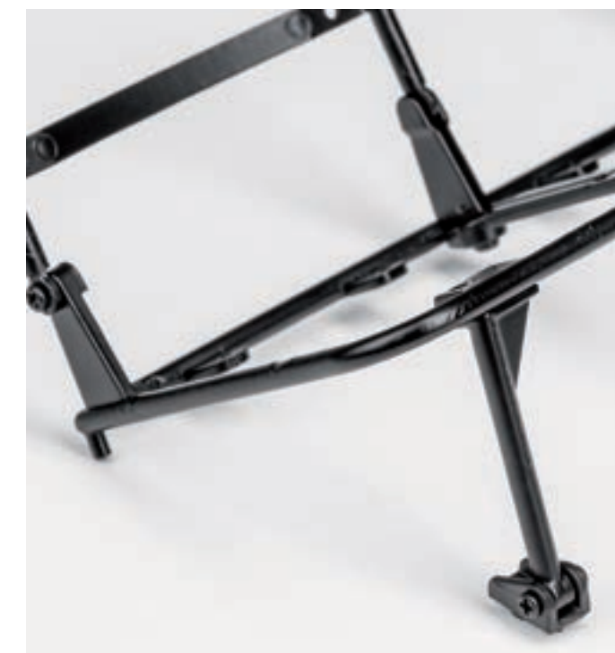
Шаг 6. При помощи двух винтов 1,7×3 (LM) закрепите петлю на правой стойке каркаса основания заднего сиденья.