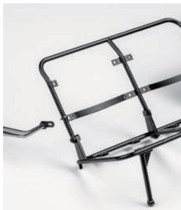
Шаг 5. На правой трубке каркаса спинки заднего правого сиденья установите и закрепите винтом 1,7×4 (СМ) правый корпус бокового запора.