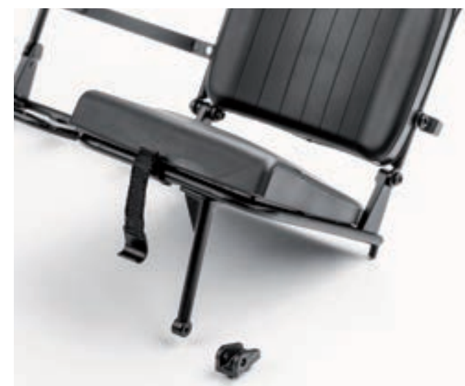
Шаг 7. Аналогичным образом установите и закрепите оставшуюся петлю на левой стойке каркаса основания заднего сиденья. Для фиксации используйте два винта 1,7×3 (LM). По окончании монтажа проверьте подвижность петель относительно каркаса заднего сиденья.