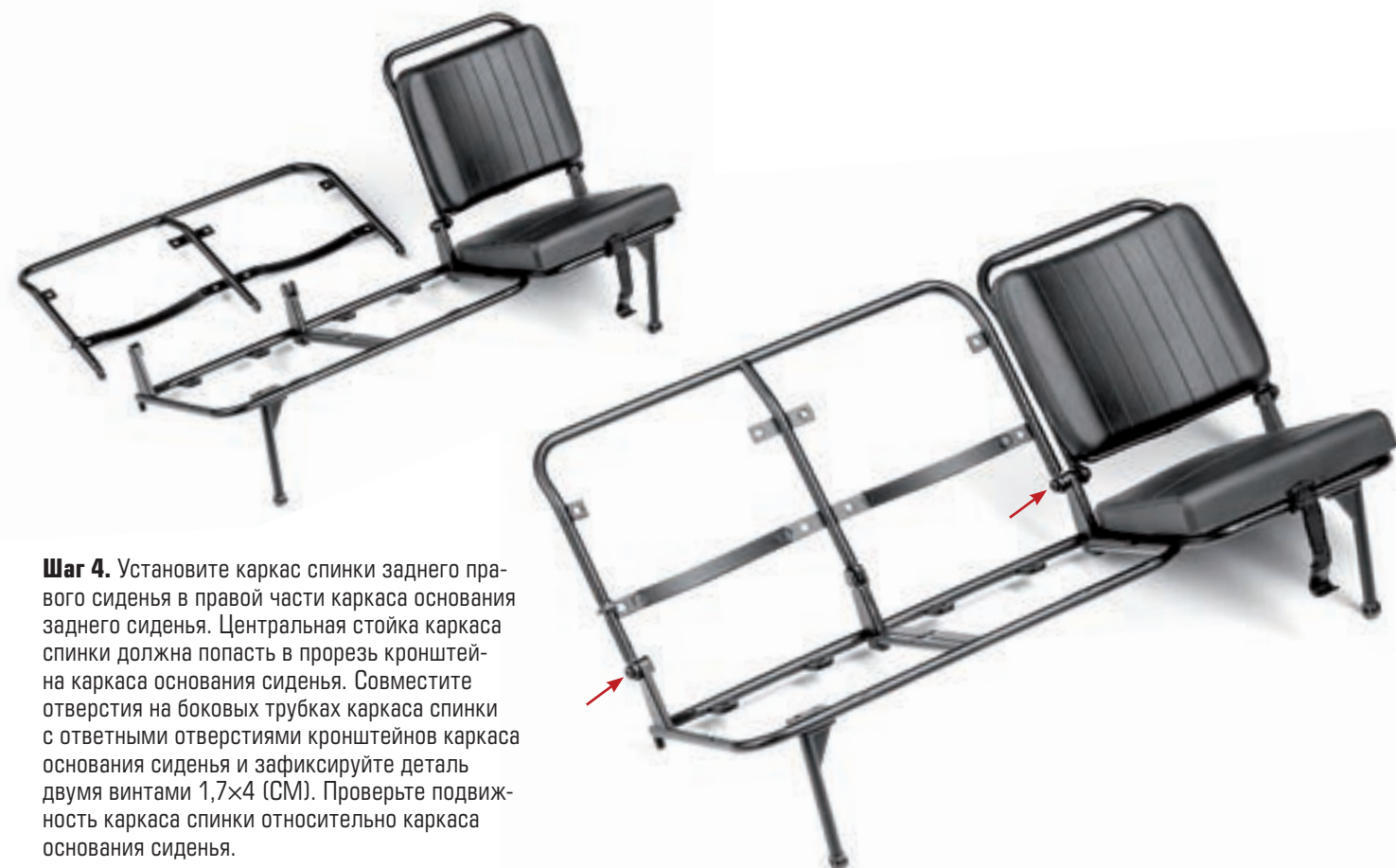
Шаг 4. Установите каркас спинки заднего правого сиденья в правой части каркаса основания заднего сиденья. Центральная стойка каркаса спинки должна попасть в прорезь кронштейна каркаса основания сиденья. Совместите отверстия на боковых трубках каркаса спинки с ответными отверстиями кронштейнов каркаса основания сиденья и зафиксируйте деталь двумя винтами 1,7×4 (СМ). Проверьте подвижность каркаса спинки относительно каркаса основания сиденья.